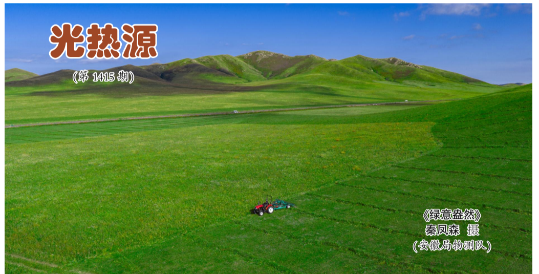
《绿意盎然》