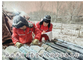
地热井项目套管下入前的准备工作

项目规划施工地热井20余口，总钻探工程量超3万米。我去的那个井场，出水温度63℃，单井涌水量123立方米/小时。第一次看到这些数字，我只是记在了本子上。直到傍晚收工，一位当地的大爷走过来，拉着技术员的手问：“今年冬天能接上暖气不？”那一刻我才反应过来，这些冷冰冰的数字