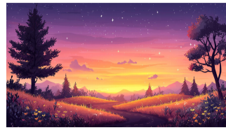
更是一颗星球绵延的记忆。

山河辽阔,步履不停。告别阿勒泰的那天,我们沿着额尔齐斯河缓缓前行,雪山、草原、毡房、林海,一一在车窗外掠过。这片金山银水,不仅留下了我们地质勘探者的足迹,更教会我们敬畏自然、坚守初心。