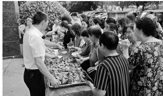
6月16日,陕西省一八六煤田地质局开展了端午节庆祝活动。30余名干部职工通过“香囊蕴艾意 锤韵寄安康”手工制作,在实践中传承传统技艺。此外,恒悦物业还为业主们准备了香甜的粽子,让大家在和谐的邻里氛围中共享节日温情。