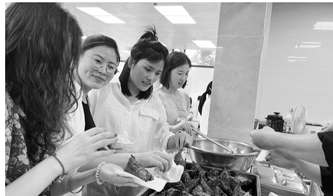
6月16日,江西省地质局能源地质大队工会联合团委开展“我们的节日·端午”主题活动。职工们通过手工制作、现场包粽子等形式,沉浸式体验传统节日氛围。食堂内粽香四溢,热气腾腾的粽子被送到职工手中,传递着浓浓的节日关怀与暖意。