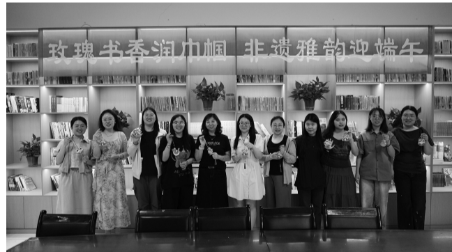
6月17日,山西省第二地质工程勘察院有限公司组织开展“玫瑰书香润巾帼 非遗雅韵迎端午”活动。女职工们在共读经典中汲取文化养分,并制作精美的端午主题珠串挂件,以独特的方式寄托国家安康、生活顺遂的美好祝愿。