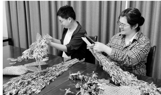
近日,山东省煤田地质局四队工会、团委及女工委联合“双报到”社区开展了端午主题活动。活动现场,大家将翠绿的艾草精心修剪、编织,制作成寓意纳福的艾草门挂。阵阵艾香中,参与者们不仅体验了传统民俗,更深刻感受到了中华优秀传统文化的独特魅力。