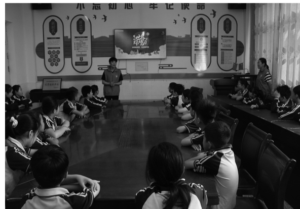
为普及地质知识、倡树环保理念,深化民族团结教育,近日,山东省煤田地质局一队走进山东省民族团结进步示范单位——滕州市滨湖镇古村民族小学,开展了“地质科普润童心 民族团结护青绿”科普志愿服务活动。志愿者们通过视频演示和实物展示,向学生们讲解地质和环保知识,让孩子们沉浸式感受自然科学的魅力。