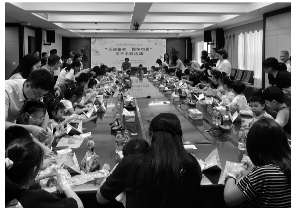
6月7日,江西省地质局第十地质大队团委联合鹰潭市自然资源局妇委会,举办了“石趣童心·探秘地质”主题活动。活动中,孩子们在“粽中挖宝”互动环节体验趣味手工,随后参观了标本陈列室。此次活动旨在让孩子们与家长在亲子时光中探索地质奥秘。