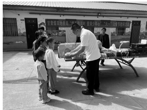
近日,甘肃煤田地质研究所走进庆阳市环县车城镇魏洼小学,开展儿童节慰问活动。慰问人员与孩子们亲切交流,详细了解他们的学习和生活情况,鼓励他们树立远大理想,长大后用知识回报家乡。随后,慰问人员为孩子们送上了文具套装、地球仪、台灯等爱心礼物。