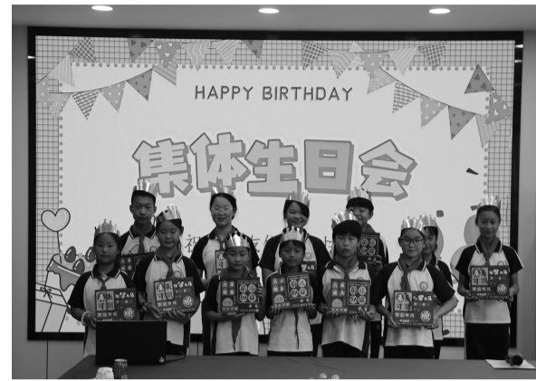
5月29日,安徽省煤田地质局三队组织开展了“暖心陪伴助成长 科学启智润童心”主题关爱活动,为宿州市埇桥区西二铺沟西小学的留守儿童送上了一份特别礼物。活动设置了集体生日会、地质科普知识宣讲和趣味科学实验3个环节,让孩子们真切感受到来自社会大家庭的温暖与陪伴。