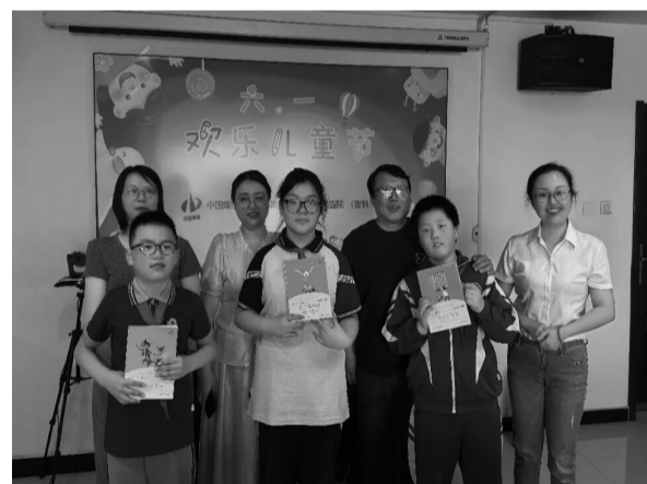
“六一”国际儿童节前夕,第一勘探局所属单位开展了系列活动,传递企业温暖与人文关怀。一九九队组织开展“家书寄深情”慰问活动,为坚守一线职工的子女送去节日祝福。二一九队组织开展“童心飞扬 梦想起航”活动,职工家庭欢聚一堂,共享亲子时光。物测队组织职工子女实地参观父母的工作场地、了解工作内容,增进对父母工作的理解与认同。勘查公司组织开展“书香润童心 关怀暖一线”主题赠书活动,鼓励孩子们以书为伴,用知识点亮梦想。华辰公司为驻外地职工的子女送上文具套装等礼物,并送去暖心问候。

征程万里风正劲,重任千钧再出发。“张雪精神”激励着每一名奋斗者奋勇争先,新时代煤炭地质事业更需这般的闯劲、韧劲与拼劲。让我们以初心为舵、以实干为桨、以创新为翼,在能源资源保障的广阔天地中乘风破浪,为煤炭地质事业高质量发展贡献磅礴力量。