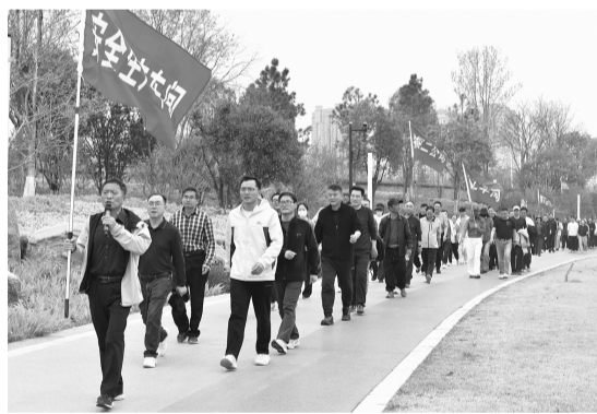
近日,安徽省煤田地质局物探队工会举办了职工健步走活动。200 余名职工在盎然春意中感受运动的魅力。

今后,107 地质队将继续发挥地质专业技术优势,聚焦群众身边的生态环境热点、难点问题,把科普宣传和技术服务紧密结合起来,让地质科学走进社区,走进老百姓的日常生活,用专业力量守护绿水青山,为建设美丽重庆贡献智慧和力量。