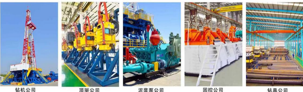
钻机公司 顶驱公司 泥浆泵公司 固控公司 钻具公司

河北永明地质工程机械有限公司占地26万平方米，拥有固定资产近5亿元，各类加工设备650余台套，集团拥有钻机公司、顶驱公司、泥浆泵公司、固控公司、钻具公司五大公司。获得美国石油学会API-5项认证，公司现是中国地质大学智能化钻井装备的战略合作单位。主要生产9000米以内的成套钻井装备及电动直驱顶驱系列产品。