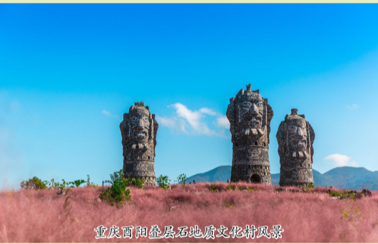
重庆酉阳叠层石地质文化村风景

从此以后 你将不再是山间冷艳之物 借着春风 你将芳华散落到人间 助叠层石地质文化村兴荣不枯