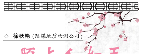
◇ 徐秋艳 (陕煤地质物测公司)