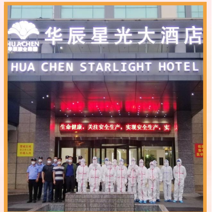
2020年6月，华辰星光大酒店成为杭州钱塘区第一家新冠肺炎疫情防控综合服务点