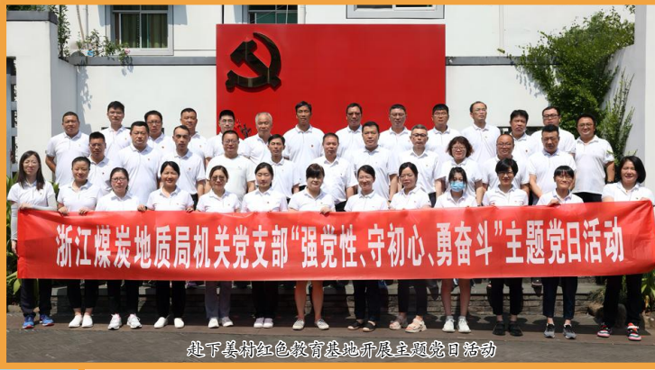
赴下县村红色教育基地开展主题党日活动