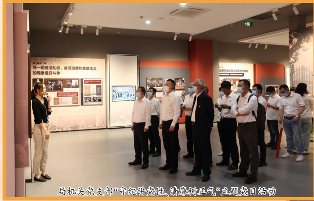
赴下县村红色教育基地开展主题党日活动