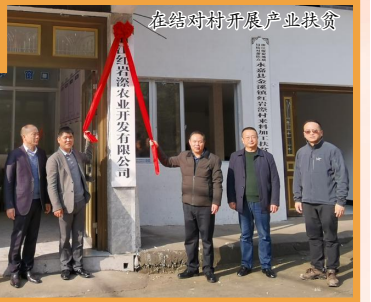
在结对村开展产业扶贫

滚滚钱塘、浩浩运河，在天堂杭州、西子湖畔，坐落着拥有60多年历史的浙江煤炭地质局。1959年，为响应国家地质找矿号召，浙江煤炭地质勘探队应运而生。60多年来，浙江煤炭地质人在中国大地上描绘出一幅幅改革发展的宏大蓝图，谱写了一曲曲气壮山河的雄伟乐章。