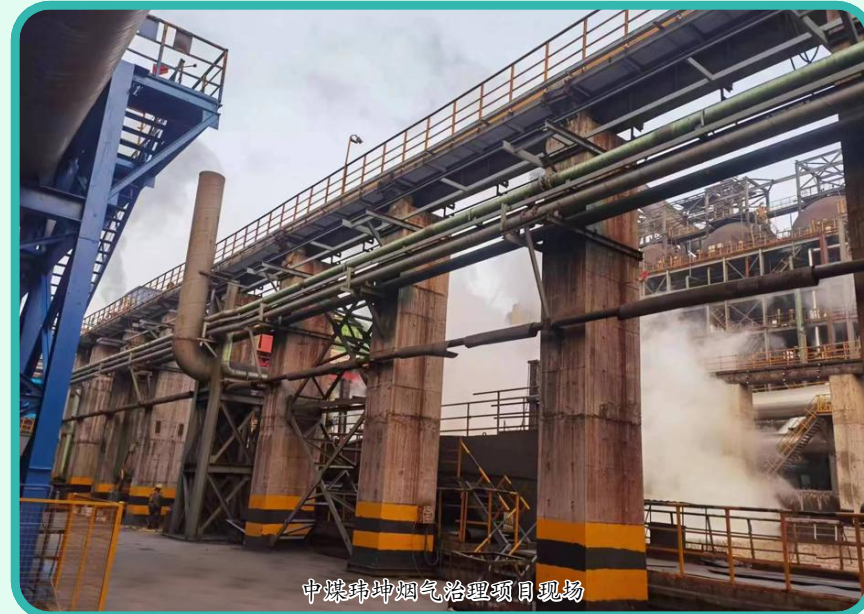
中煤玮坤烟气治理项目现场