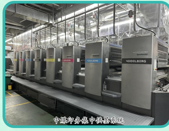
中煤印务集中供气系统