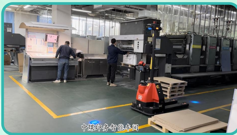
中煤印务智能车间