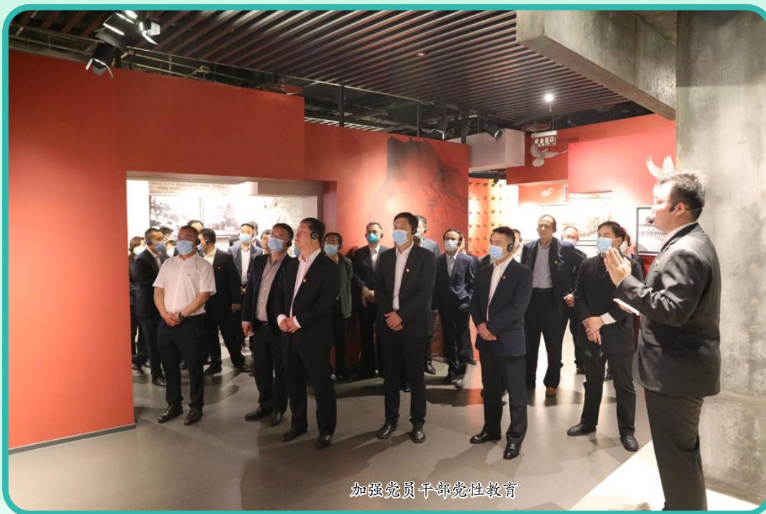
加强党员干部党性教育

“勤耕不辍、自强不息”是二勘局人的奋斗姿态。“惟志惟勤、善做善成”是二勘局的企业精神。2006年，在中国煤炭地质总局推进在京单位企业化改革的进程中，第二勘探局应运而生。从服务总局涿州基地后勤的事业单位起步，二勘局始终肩负改革发展和建设服务老基地两大重任，在探索中前行，在逆境中成长，在拼搏中壮大，向着建设中国特色现代企业集团笃定前行。