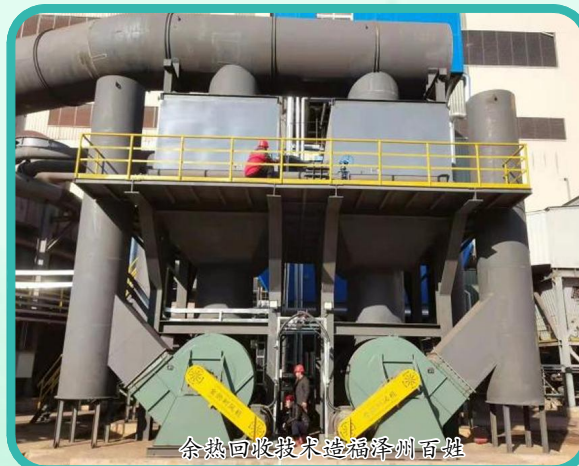
余热回收技术造福涿州百姓