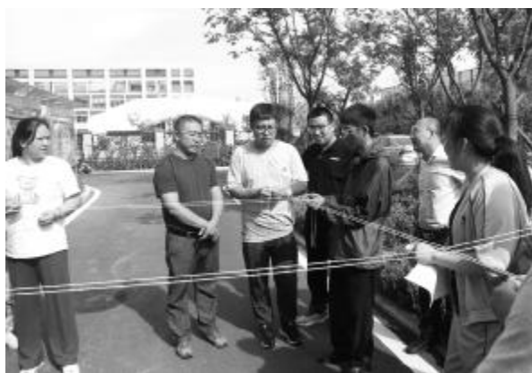
九月八日,山东省煤田地质局一队举办了“迎佳节、庆中秋”系列主题活动,包括猜灯谜、中秋诗词大会、嫦娥奔月、中秋接福四大项。

●9月8日,江西省地质局能源地质大队团委与地理信息工程大队团委联合开展“喜迎二十大 学党史话初心”主题中秋晚会,两队地质青年分享了长征路上红军度过的两个中秋节的故事,学习了红军战士面对困难无所畏惧的英雄气概。主题中秋晚会还设置了游戏环节,地质青年们同心协力完成分组任务、品尝美味月饼、自己动手制作兔子灯,开展单身青年联谊,活动内容丰富、精彩纷呈。徐佳 熊子欣