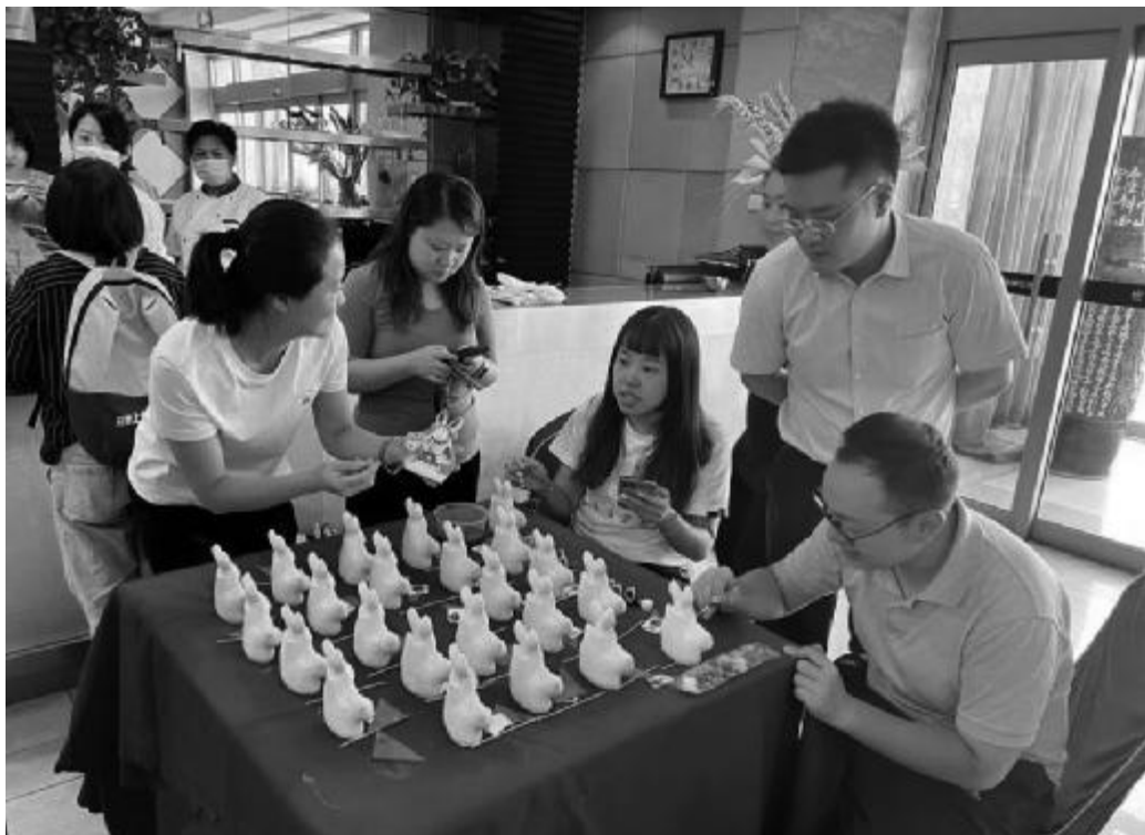
九月七日,中煤建工集团有限公司团委联合工会组织开展了“快乐中秋节,亲手绘兔爷”中秋传统文化活动。职工亲手绘制的兔爷为佳节增添了一份喜庆。