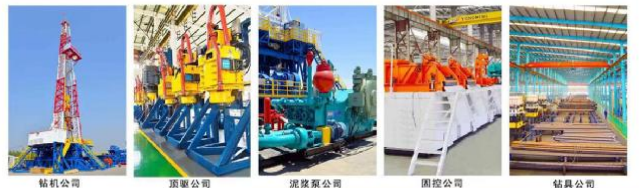
钻机公司 顶驱公司 泥浆泵公司 固控公司 钻具公司

河北永明地质工程机械有限公司占地26万平方米，拥有固定资产近5亿元，各类加工设备650余台套，集团拥有钻机公司、顶驱公司、泥浆泵公司、固控公司、钻具公司五大公司。获得美国石油学会API-5项认证，公司现是中国地质大学智能化钻井装备的战略合作单位。主要生产9000米以内的成套钻井装备及电动直顶顶驱系列产品。