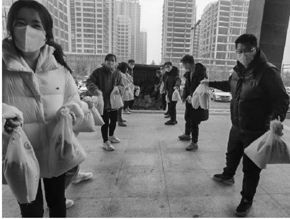
洛阳市伊川县平平等乡上元村是河南省煤田地质局的定点帮扶村,该局已连续六年通过“消费扶贫”的方式,帮助该村村民销售农副产品。此次河南局属单位共购买小米、粉条、花生等农副产品共计2890斤,价值二十五万余元。图为河南局资产环二院购买农产品后卸车的情景。

多年来,李红云先后荣获中煤地质报优秀新闻工作者、陕投集团和陕煤地质报优秀党务工作者、优秀共产党员、“践行君子文化”先进个人、陕西能化工会和陕煤地质“巾帼标兵”,连续10年被陕煤地质评为“优秀通讯员”“优秀信息员”;所负责的党委工作部荣获陕煤地质集团“五一巾帼标兵岗”,多次被评为公司先进部室。她撰写的多篇论文获中煤地质报、陕西煤炭工业协会政研会、省应急管理厅、陕投集团和陕煤地质集团奖励。