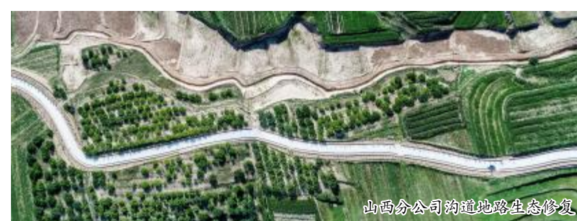
山西分公司沟道道路生态修复

事”抓好为民服务。一勘局党委着眼长远,为群众解决关乎切身利益的生态环境、居住环境问题,积极投身矿山环境修复、现代农业地质技术服务领域,在企业发展中惠泽于民,在为民纾困解难中彰显央企担当。同时,抓细抓小,聚焦职工群众“急难愁盼”的具体问题,形成“我为群众办实事”项目清单。截至6月底,全局已落实完成86%。