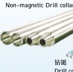
钻铤 Drill collars